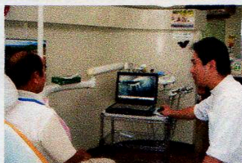
撮影した画像を患者と一緒に見ながら状態を説明。