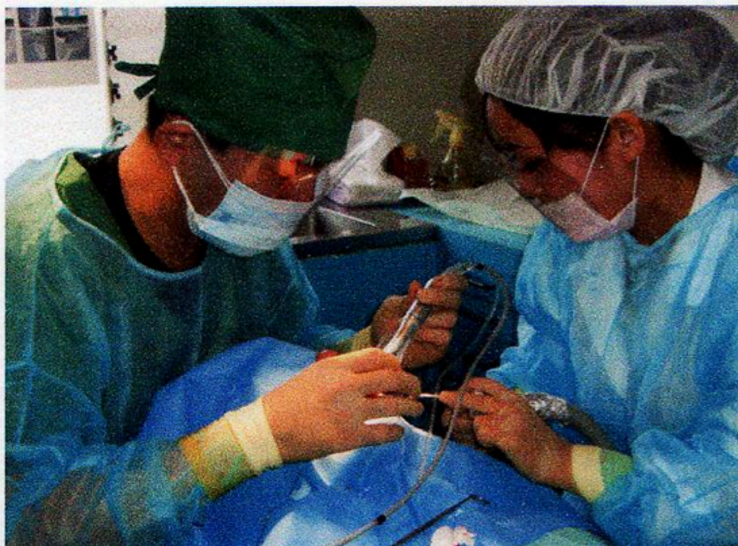
インプラント手術の様子。